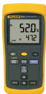
Fluke 52 II