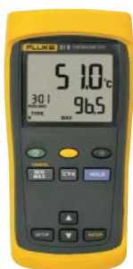
Fluke 51 II