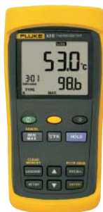
Fluke 53 II